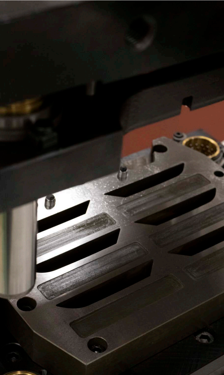
Troquel de corte