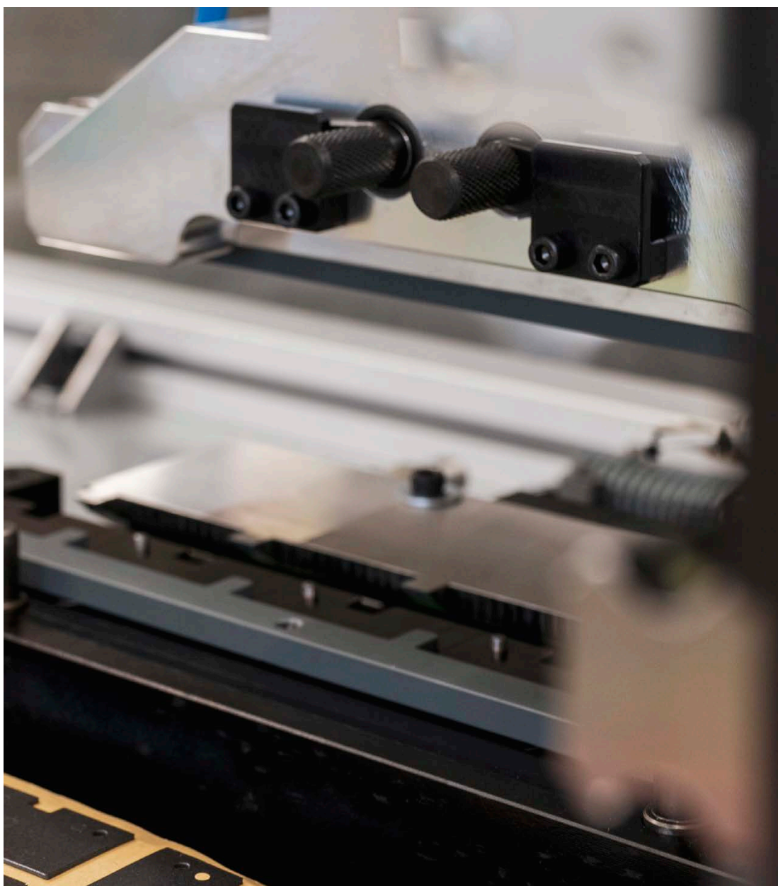
Puesto de premontaje de logotipos

En Comegal destinamos nuestra fabricación principalmente al sector de automoción, aunque somos una empresa multisectorial trabajando para sectores tan variados como telecomunicaciones, ingenierías o envase metálico.