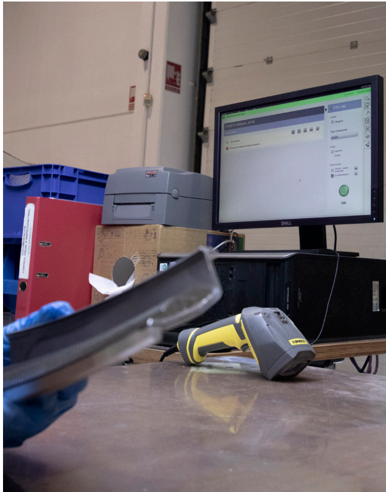
Puesto de operario gestionado mediante trazabilidad